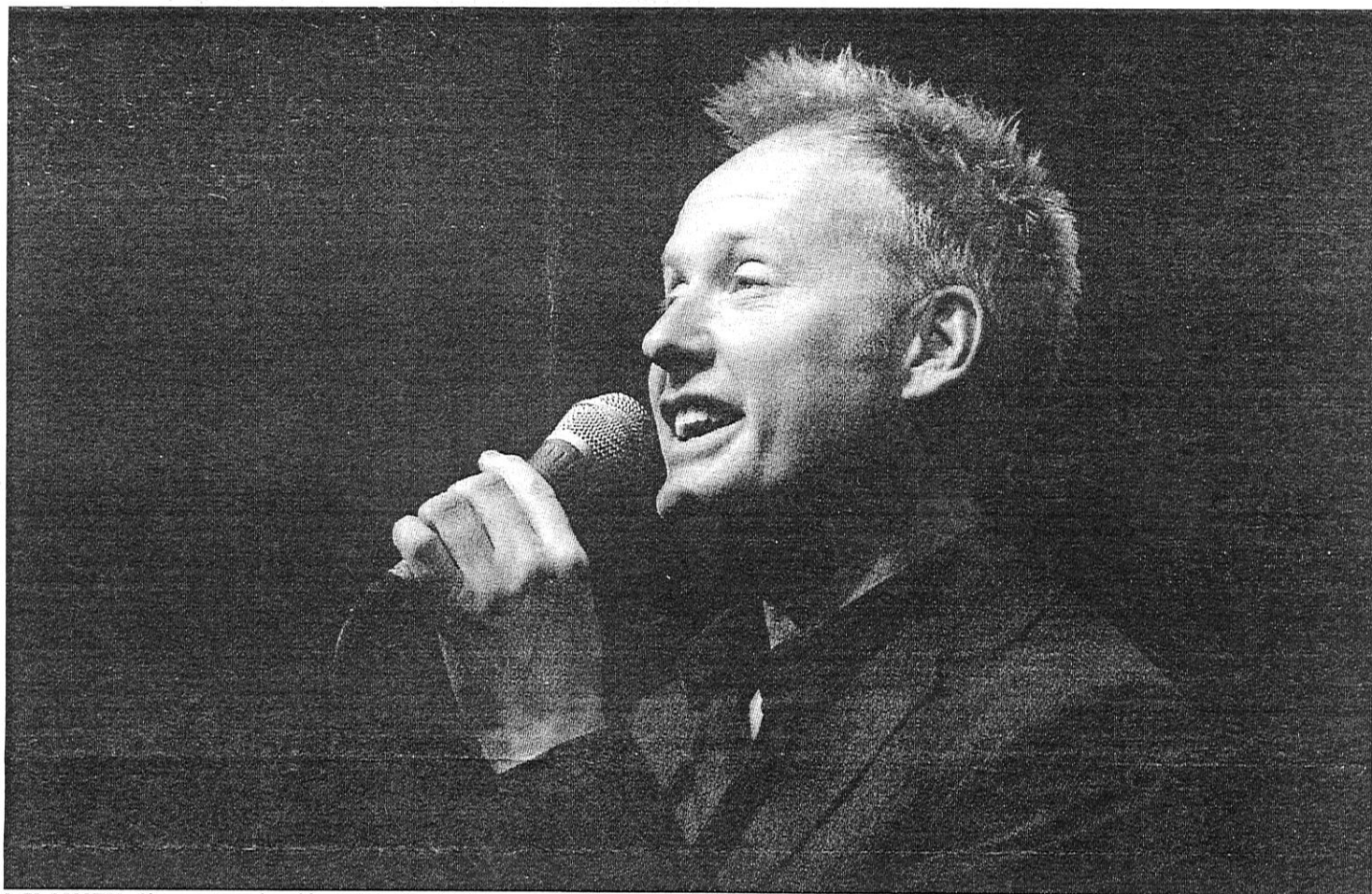
I GLANSEN: Sigvart Dagsland begeistret publikum med solide konserter i kulturhusene i Kvinesdal og Sirdal torsdag og lørdag i forrige uke.